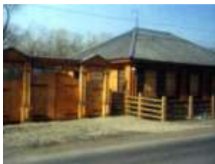
Дом-музей Ф.М. Достоевского

Самое большое озеро Кузбасса Берчикуль расположено в Тисульском районе Кемеровской области. Местные народы испокон века звали его Берчикуль или Волчье озеро. Озеро Берчикуль — одно из самых посещаемых туристами мест в Тисульском районе Кемеровской Области. Многие туристы приезжают на озеро для занятия рыбалкой.