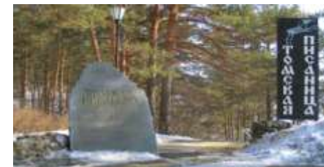
Камень на вершине скалы

постъ — памятник истории и архитектуры федерального значения, находится в Кузнецком рай-