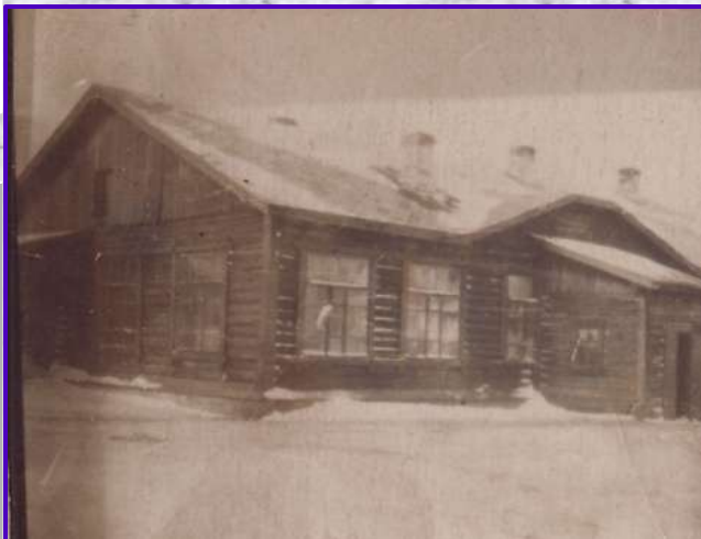
Здание школы № 92 накануне войны