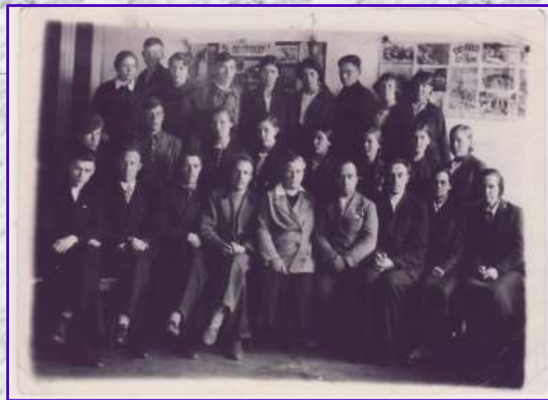
Выпуск 1941 года