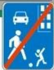
Знак "Конец жилой зоны"