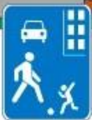
Знак "Жилая зона"

ПРАВИЛО 3: Не играй на проезжей части дороги даже во дворе собственного дома.