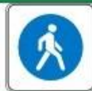
Знак "Пешеходная зона"